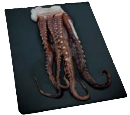
tentakels van pijlintvis 33.020.20