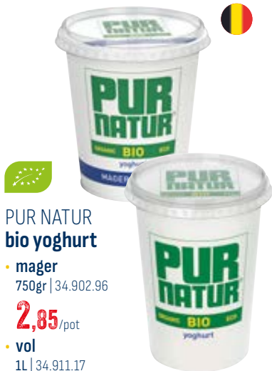
PUR NATUR bio yoghurt