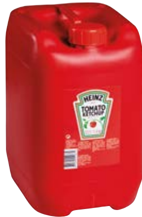
HEINZ ketchup tomaat 10L | 26.325.38