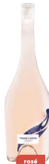
FONCALIEU Terre d'Eden rosé Languedoc 75cl | 08.502.00