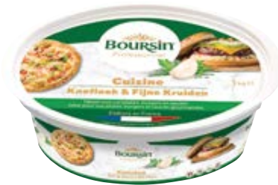
BOURSIN cuisine kruiden en look 1kg | 34.250.00