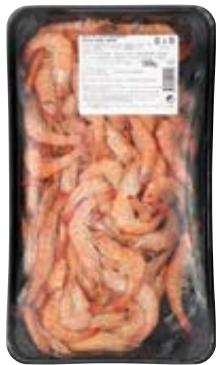
gehele gekookte garnalen 60/80 1kg | 34.800.62