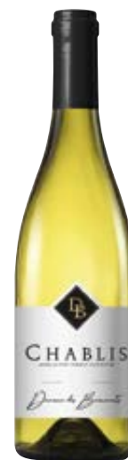
DOMAINE LES BEAUMONTS chablis 75cl | 08.100.24