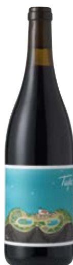
ST.DONAT Tufa 75cl | 08.502.01