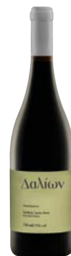
MARKOGIANNI WINERY dalion mavrodapne 2021 75cl | 08.902.75