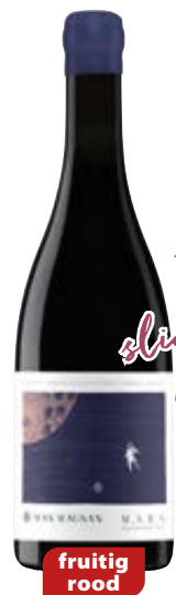
NIEUW MAS MAGNAN M.A.R.S 'grenache' 75cl | 08.590.07

Fruitbom! slightly chilled op zijn best!