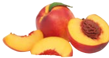
nectarine extra uit Frankrijk