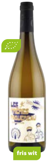
PAQUEREAU sauvignon gris 75cl | 08.401.01