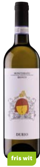
NIEUW DURIO Monferrato chardonnay 75cl | 08.500.57