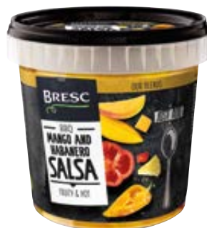
BRES C mango en habanero salsa 1kg | 34.100.35