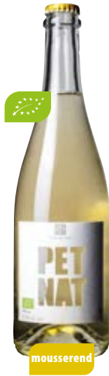
DOMAINE VADE pet nat 75cl | 08.900.80