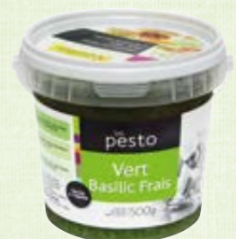
SOBREVAL groene pesto 20% 500gr | 54.800.35