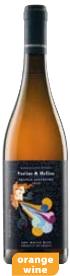
MARKOGIANNI WINERY vorias & helios orange assyrtiko 75cl | 08.903.02