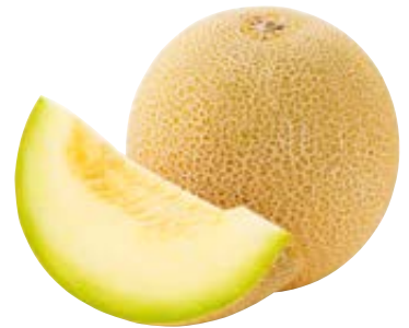
meloen galia 58.501.01