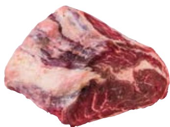
KETTYLE lerse ribeye dry aged in zoutkamers ±2,8kg | 50.010.04