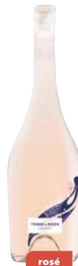
FONCALIEU Terre d'Eden rosé Languedoc 75cl | 08.502.00