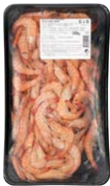
gehele gekookte garnalen 60/80 1kg | 34.800.62