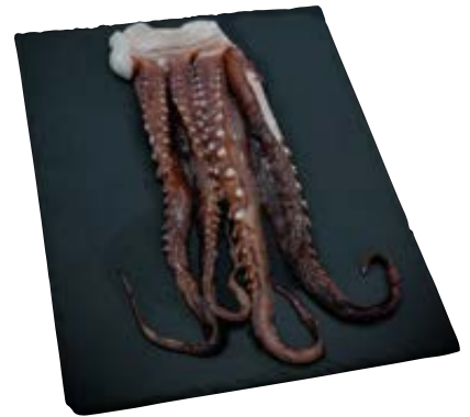
tentakels van pijlintvis 33.020.20