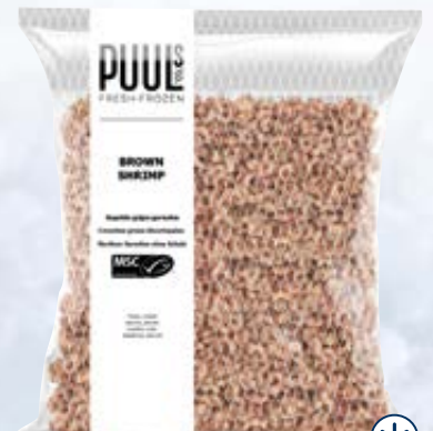
KLAAS PUUL gepelde grijze Noordzee garnaal 1kg | 36.700.04