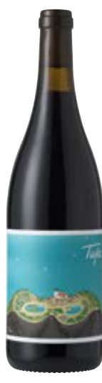
ST.DONAT Tufa 75cl | 08.502.01