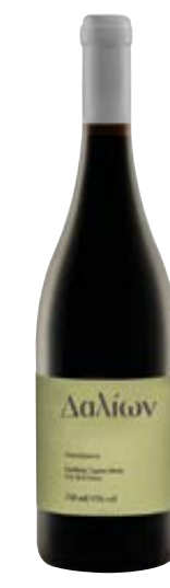
MARKOGIANNI WINERY dalion mavrodapne 2021 75cl | 08.902.75