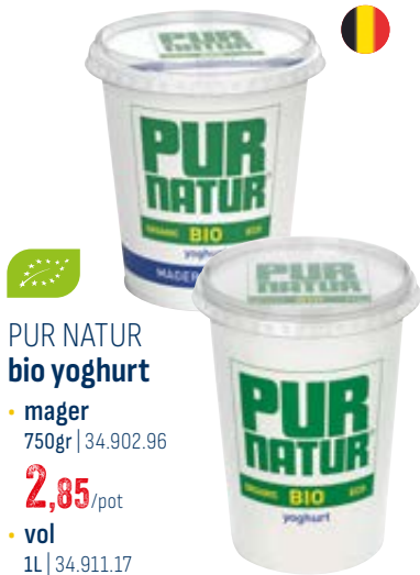
PUR NATUR bio yoghurt