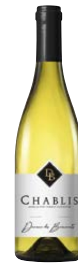
DOMAINE LES BEAUMONTS chablis 75cl | 08.100.24