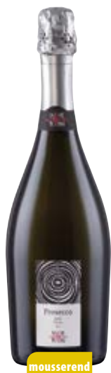
COSTE PETRAI prosecco brut DOC 75cl | 09.400.60