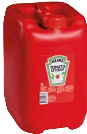
HEINZ ketchup tomaat 10L | 26.325.38