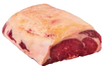
KETTYLE lerse 1/2 striploin dry aged in zoutkamers ±2,5kg | 50.010.01