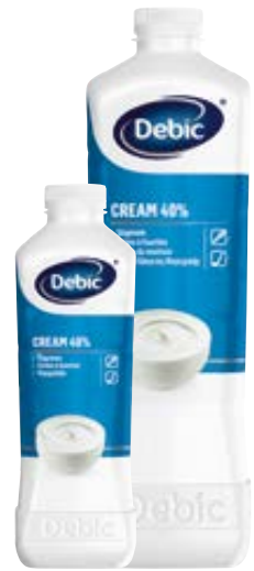
DEBIC room 40%