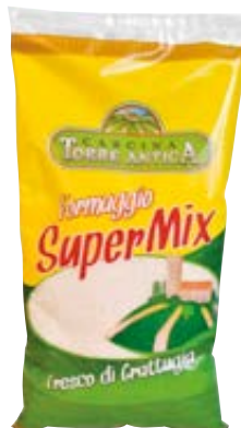
CASCINA TORRE ANTICA gemalen Italiaanse kaas