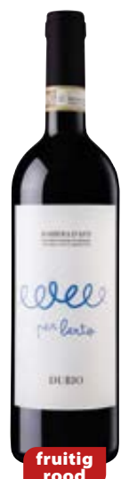
NIEUW BARBERA D'ASTI per berto 75cl | 08.500.56