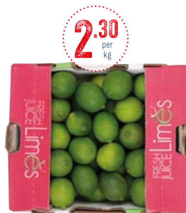
limoen 4,5kg | 58.300.19