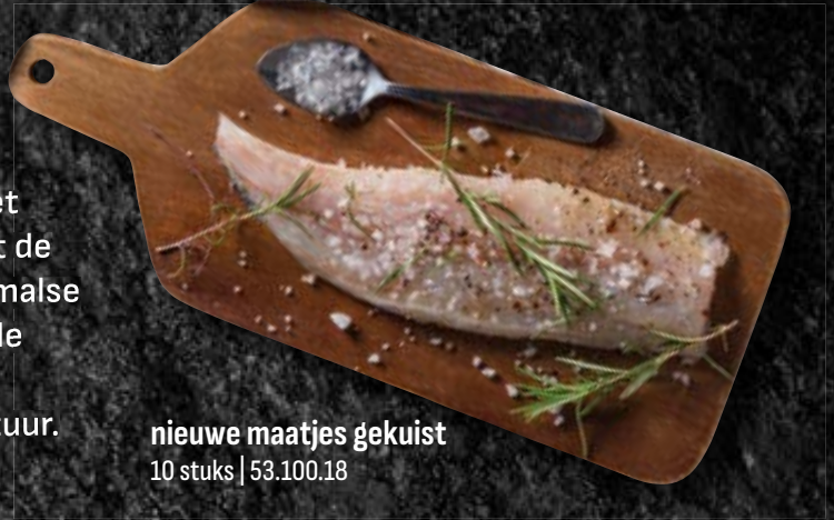
nieuwe maatjes gekuist 10 stuks | 53.100.18

Het haringseizoen start vanaf 17 juni met de Hollandse Nieuwe. In zes weken wordt de volledige jaarvoorraad gevangen: vette, malse maatjes vol smaak. Dankzij de traditionele 'haringkaak'-methode en rijping in pekel ontstaat die kenmerkende zachte structuur. Perfect voor op de kaart deze zomer!