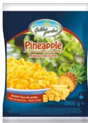
GOLDEN GARDEN ananas dice tropical gold Philipines 10x10mm 2,5kg | 36.401.42