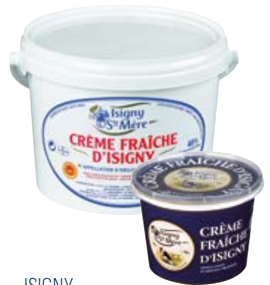
ISIGNY zure room AOP