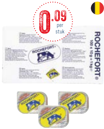
ROCHEFORT botercups 100 x 10gr | 34.601.94