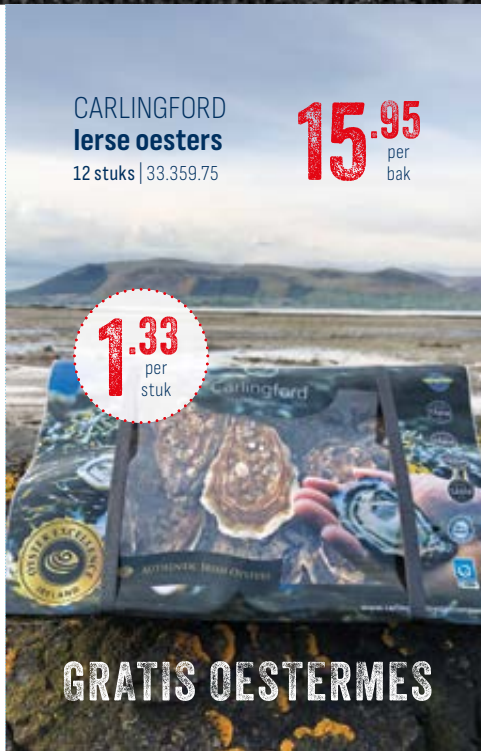
CARLINGFORD Ierse oesters 12 stuks | 33.359.75