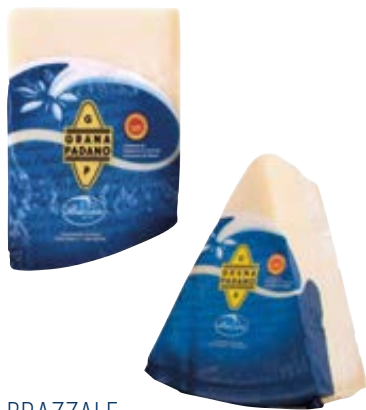
BRAZZALE grana padano DOP