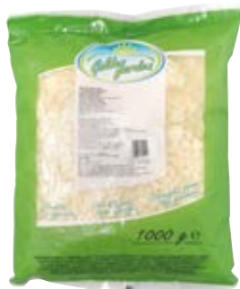
GOLDEN GARDEN lookblokjes 4x4mm 1kg | 36.313.54