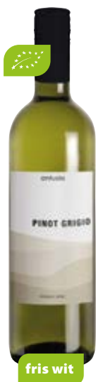
ANTUSIA pinot grigio veneto 75cl | 08.901.13