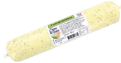
CAFE DE PARIS boter