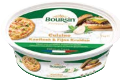
BOURSIN cuisine kruiden en look