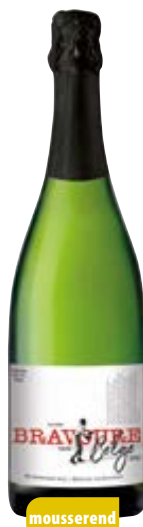
WIJNDOMEIN HOENSHOF bravoure belge 75cl | 09.401.07