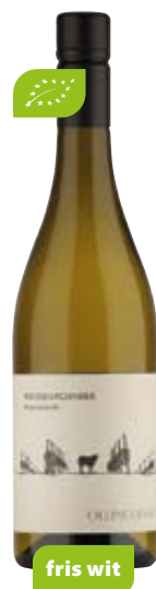
NIEUW WEINGUT OLLINGER weissburgunder muschelkalk 75cl | 08.900.24