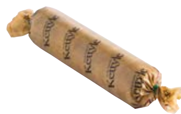
KETTYLE lers rund merg voorbereid 200gr | 36.930.12