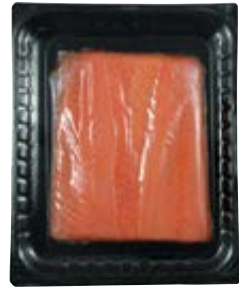
gerookte zalmsneetjes lange snede