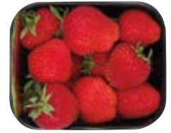
aardbei Belgisch 500gr | 58.000.06