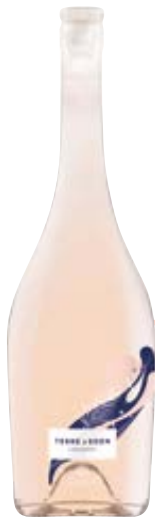
FONCALIEU Terre d'Eden rosé Languedoc 75cl | 08.502.00