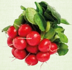
radijs rood 59.432.00