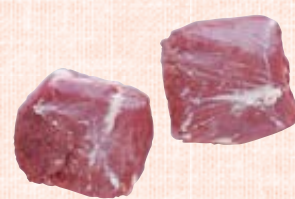
MASTER CHEF EDITION lamsheupjes uit Nieuw-Zeeland