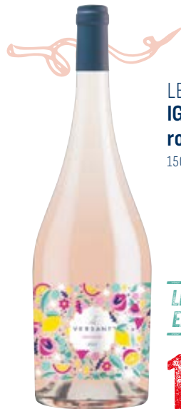
LE VERSANT IGP OC magnum rosé 150cl | 08.500.03