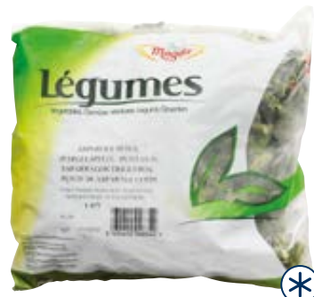
MAGDA groene asperges 1kg | 36.350.00