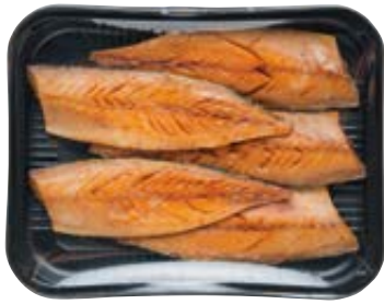
makreelfilets gerookt natuur