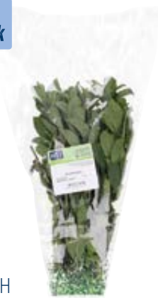
HTPRO FRESH munt