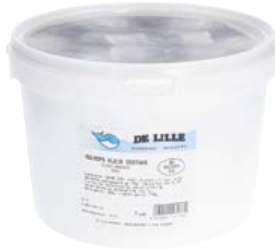
DE LILLE rolmops