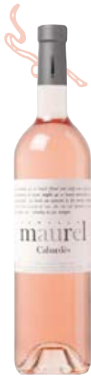
DOMAINE MAUREL rosé 75cl | 08.500.99