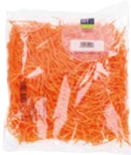
HTPRO FRESH wortel geraspt