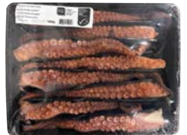
OCEAN PRIDE gekookte octopus tentakels 100-150gr