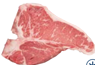
FREYGAARD T-bone uit Finland