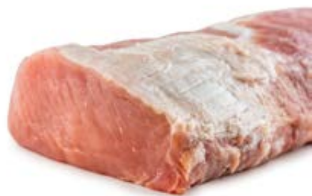
kalf dunne lende