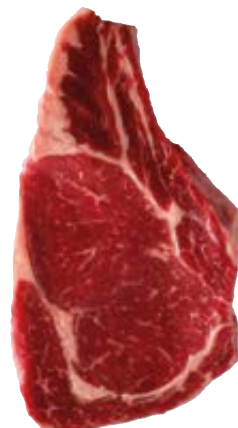
lense côte a l'os