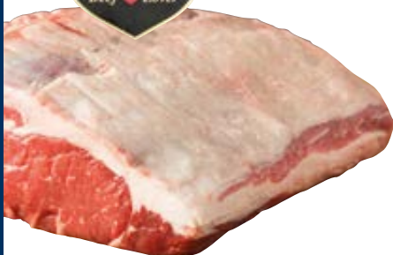
SASHI dryaged entrecôte