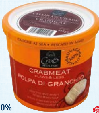
CRABHOUSE krabvlees 100% madagascar