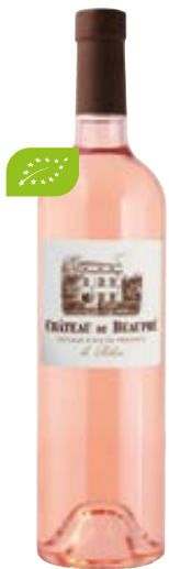
CHATEAU BEAUPRE cuvée le château rosé 75cl | 08.500.15