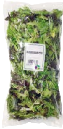
salanova mix 500gr | 59.100.57