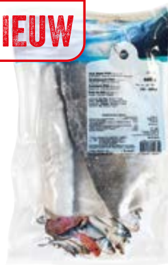
OCEAN PRIDE zeebaars op vel zonder graten IQF 80-120g