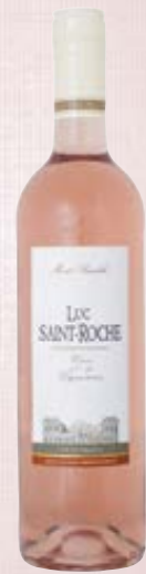
LUC ST-ROCHE rosé 75cl | 08.500.22